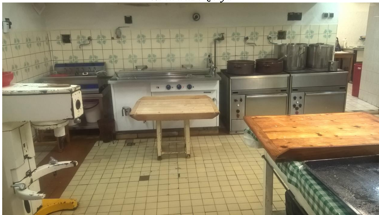
Zařízení staré kuchyně